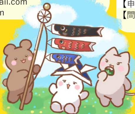
【イラスト協力】 女子美術大学 幸島新夏さん