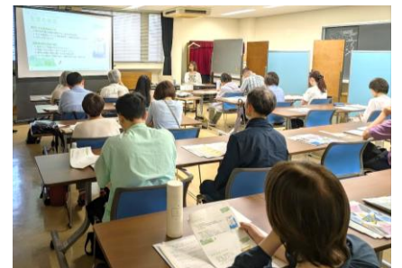
▲参加者の皆さんが熱心に受講する様子

第1部では井の頭線エリアで活動されているゲストの3名から、団体の活動内容やボランティア活動の様子、エピソード等をご紹介いただきました。第2部は、受講者からの質問にお答えいただく座談会を行いました。参加者の皆さんからは、「ボランティアに参加する回数を増やそうと思った」といった声をいただき、活動への参加や継続につながる機会となりました。