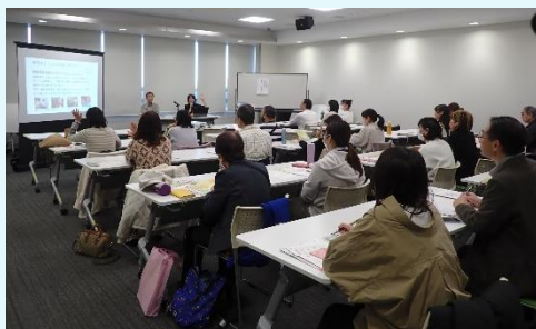
▲ゲストがいきいきと話す姿に、受講者も熱心に聞いていました

11月28日(金)にウェルファーム杉並にて、チャレンジ！ボランティア 地域とつながろう講座「あなたの暮らしにちょこっと地域参加」を開催し、18名が参加されました。