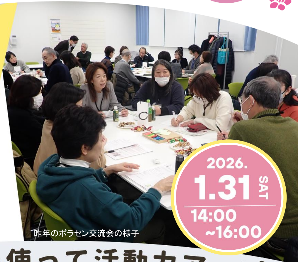
昨年のボラセン交流会の様子